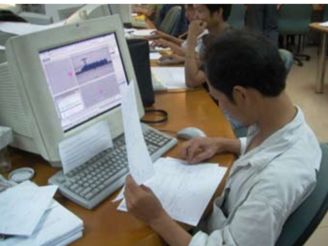
Uusi pitkä elokuva on tekeillä Ho Chi Minhissä Sparx-studiolla.