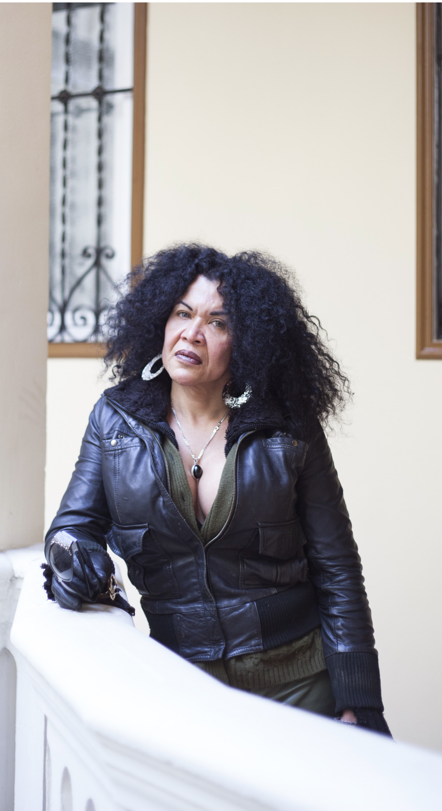
prostituoituna jo 20 vuotta. Prostituutio halutaan kriminalisoida Espanjassa: monet näkevät sen alustana ihmiskaupalle.

Prostituoiduista se tekisi lain rajamailla olevien naisten sijasta työssä käyviä kansalaisia.