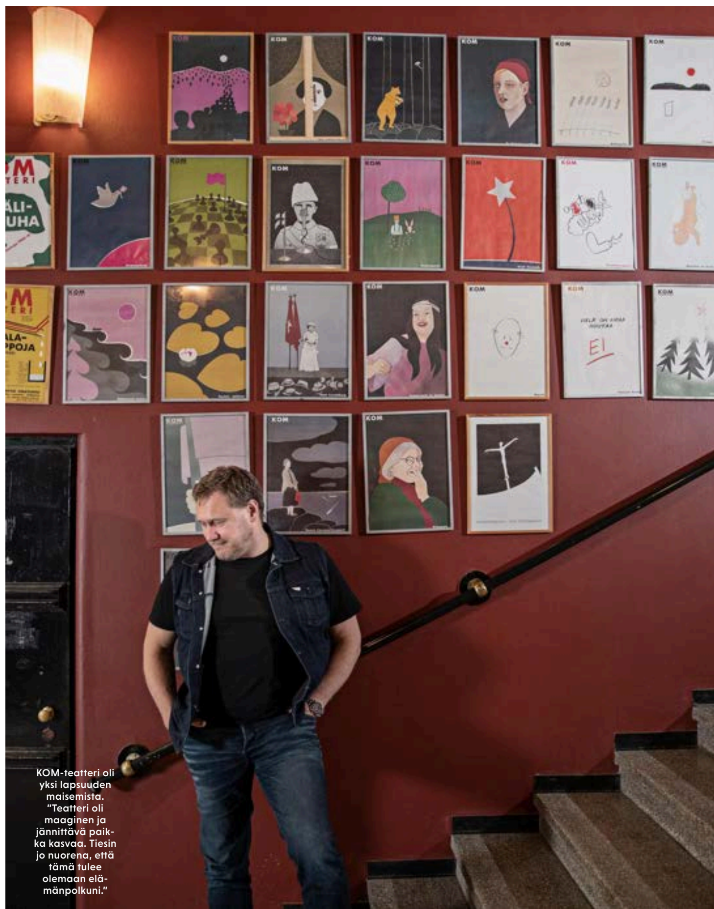
KOM-teatteri oli yksi lapsuuden maisemista. "Teatteri oli maaginen ja jännittävä paikka kasvaa. Tiesin jo nuorena, että tämä tulee olemaan elämänpolkuni."