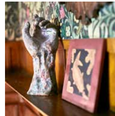
■ Ruokailuhuoneen syvennystä koristavat taidokkaat yksityiskohdat.