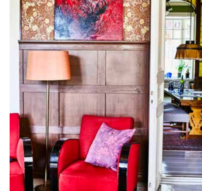
■ Jokainen huone on kurkistut uuteen maailmaan. Tilava eteinen sai yllleen rohkeaa punaista.