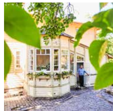
■ Mukulakivistä tehty piha ja vanhat perinnekasvit ovat kuin aikamatka viime vuosihannen alkuun.

”Kun tytär oli illalla nukahtanut, jatkoimme remontoimia. Välillä kävi mielessä, ettei tässä ole mitään järkeä.”