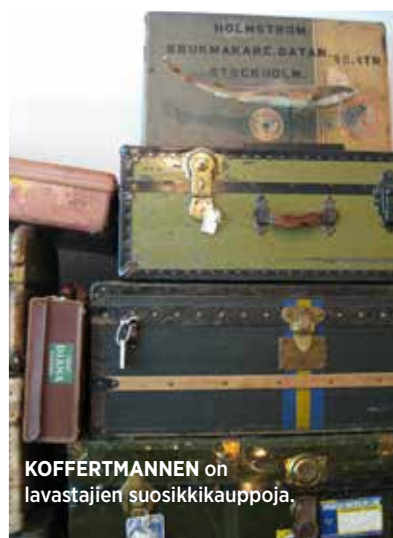
KOFFERTMANNEN on lavastajien suosikkikauppoja.