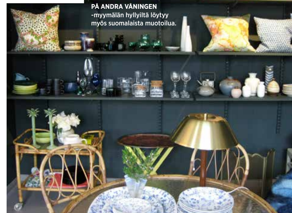
PÅ ANDRA VÅNINGEN -myymälän hyllyiltä löytyy myös suomalaista muotoilua.